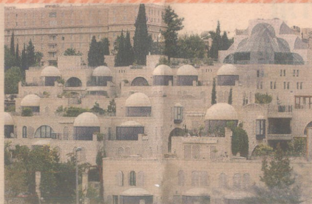
תעריפי שיא בין מגורים ומסחר במסילא היקרתית, למגורים ומסחר באזורי מרכז העיר

במספרות ואולמות באולינג, יש פערים בשיעור עשרות אחוזים בין ירושלים לשאר הרשויות המקומיות. ירושלים גובה את הארנונה הגבוהה ביותר מעסקים אלו מבין הרשויות שנבדקו, כך גם ממאפיות של מצות - שלכאורה אוכלוסייתה אמורה לצרוך באופן יותר שכיח. המפתיע אגב בנוגע לממצא האחרון הוא שעיריית בני ברק גובה ארנונה אף גבוהה מזו. נאור אליהו הכותב הוא מנכ"ל חברת ערך